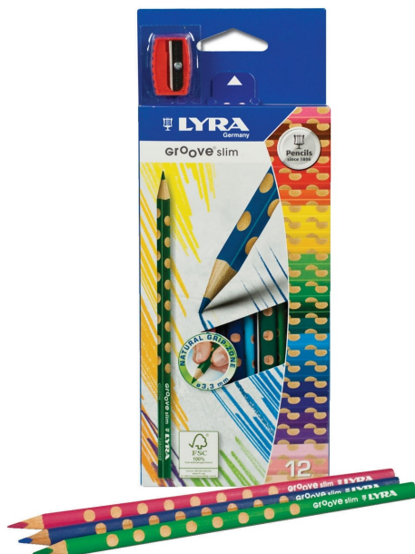
2549 BARVICE trikotne TANKE 1/12 LYRA GROOVE SLIM