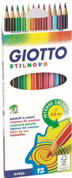
9093 BARVICE TANKE STILNOVO 1/12 GIOTTO