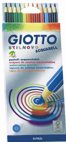
8845 BARVICE TANKE AQUAREL STILNOVO 1/12 GIOTTO