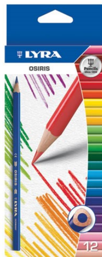
8704 BARVICE LYRA trikotne Osiris 1/12