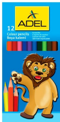
2620 BARVICE TANKE 1/12 ADEL